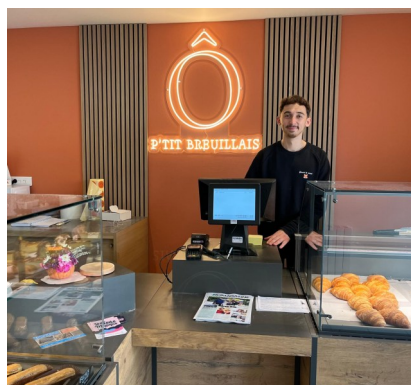
La boulangerie - pâtisserie

Au centre de la vie locale, la place des Caneteries s'affirme aujourd'hui comme un lieu dynamique, convivial et essentiel au quotidien des habitants. Elle illustre le dynamisme de notre commune et le rôle central que jouent les commerces de proximité, les services et le marché du dimanche matin dans son attractivité.