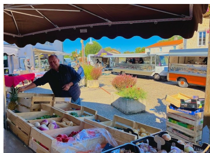
Le marché du dimanche matin

A partir du vendredi 27 février, en soirée, retrouvez le Beer Truck Bar'Nabé place des Caneteries.