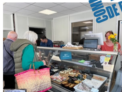
La boucherie - charcuterie - traiteur