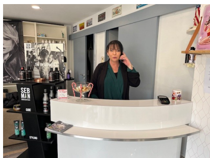
Le nouveau salon de coiffure